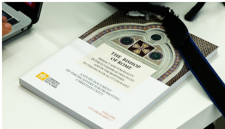
Documento de estudio “El Obispo de Roma”.

La primacía del Papa ha sido siempre uno de los mayores obstáculos en el camino hacia la plena unidad de las Iglesias cristianas. El diálogo ecuménico avanza y ahora el Dicasterio para la Promoción de la Unidad de los Cristianos publicó un documento de estudio, “El Obispo de Roma. Primacía y sinodalidad en los diálogos ecuménicos y respuestas a la encíclica Ut unum sint ”, con la aprobación del Papa Francisco, que resume por primera vez las respuestas a la encíclica de san Juan Pablo II y a los diálogos ecuménicos sobre la cuestión de la primacía y la sinodalidad. El documento concluye con una propuesta del Dicasterio que identifica las sugerencias más significativas presentadas para un ejercicio renovado del ministerio de unidad del Obispo de Roma “reconocido por todos y cada uno”.