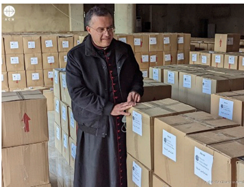
Monseñor Charbel Abdallah, arzobispo maronita de Tiro, Líbano.

ACN y la Iglesia local del sur del Líbano hacen un llamado a la oración para que se reinstaure la paz en la región. El continuo lanzamiento de misiles que impactan en el sur del Líbano está sumiendo a sus habitantes en una pobreza aún mayor de la que ya venían padeciendo desde 2019 debido a la terrible crisis económica. La Iglesia permanece al lado de la población y la atiende en sus necesidades, ofreciendo un conmovedor testimonio de valentía.