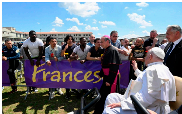
Llegada del Papa Francisco a la cárcel de Montorio, durante su visita pastoral a Verona.

El sábado 18 de mayo el Papa Francisco partió en helicóptero para realizar una Visita Pastoral a Verona, la que comenzó con un encuentro con sacerdotes y consagrados en la Basílica de San Zenón y luego con niños y jóvenes en la plaza de San Zenón. En la Arena de Verona el Santo Padre presidió el encuentro “Arena de Paz - Justicia y