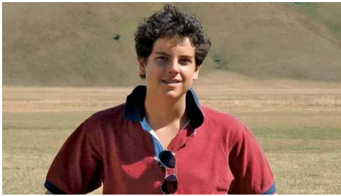
Carlo Acutis.

su exposición sobre los milagros eucarísticos, por ejemplo. En octubre de aquel año una leucemia fulminante se lo lleva, pero no lo que construyó. El Papa Francisco lo beatificó en 2020 en Asís, donde ahora descansa en el Santuario de la Expoliación, y a fines de mayo se aprobó el decreto para su canonización al comprobarse un segundo milagro por su intercesión.