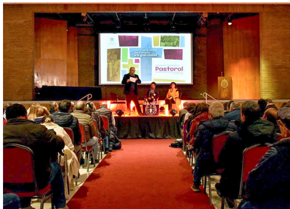
Primer día de la Semana Teológico Pastoral 2024.

Entre el 2 y 5 de julio se celebró la Semana Teológico Pastoral 2024 en Santiago. Esta edición abordó como temática principal la pastoral en la gran ciudad. Expertos nacionales e internacionales entregaron pistas, experiencias y prácticas para el encuentro de las personas en los diferentes contextos urbanos, y el anuncio de la Buena Noticia de Jesucristo.