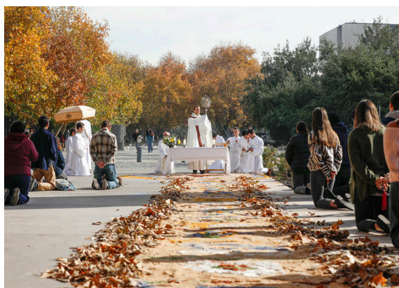
Celebración del Corpus Christi en Campus de la UC.